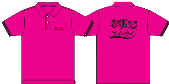
00302-ACT ドライポロシャツ (Hピンク)