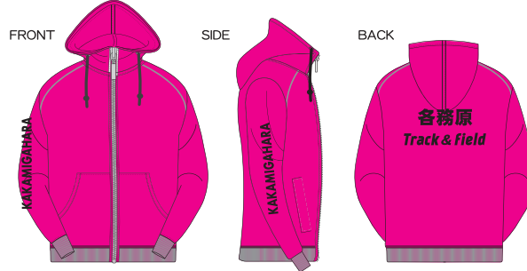
P3010 ドライスウェットパーカー