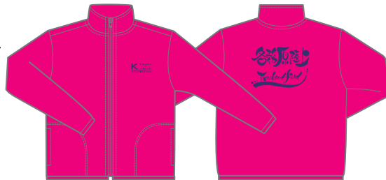
00358-AMJ ドライスタンドジップ (146Hピンク)