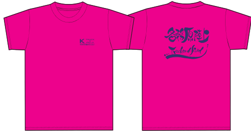
00300-ACT ドライTシャツ (Hピンク)