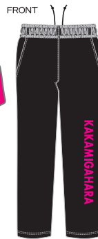
P3050 ドライスウェットパンツ